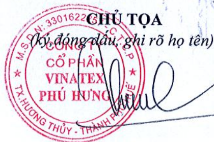
TRẦN HỮU PHONG